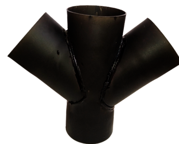
JUNÇÃO Y DUPLO