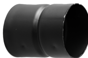
JUNÇÃO I (AN)