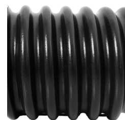
JUNÇÃO I (HL)